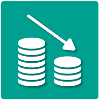
Low maintenance costs Geringe Wartungskosten