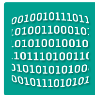
Data storage and recipe administration Datenspeicherung und Rezepturverwaltung