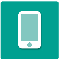
Connect app available Verfügbarkeit der Connect-App