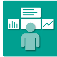
Logging of operating data Schnittstelle zur Betriebsdatenerfassung